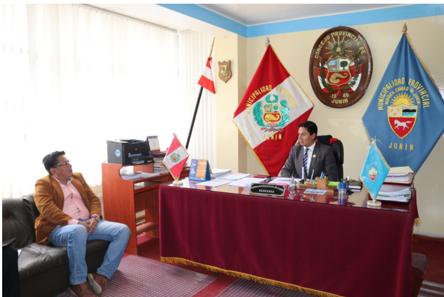
Despacho del señor Alcalde de la Municipalidad Provincial de Junín

El alcalde provincial expresó su felicitación por el trabajo que viene realizando el Presidente de la Corte, asimismo agradeció por la invitación a la feria en la cual participaran con entusiasmo.