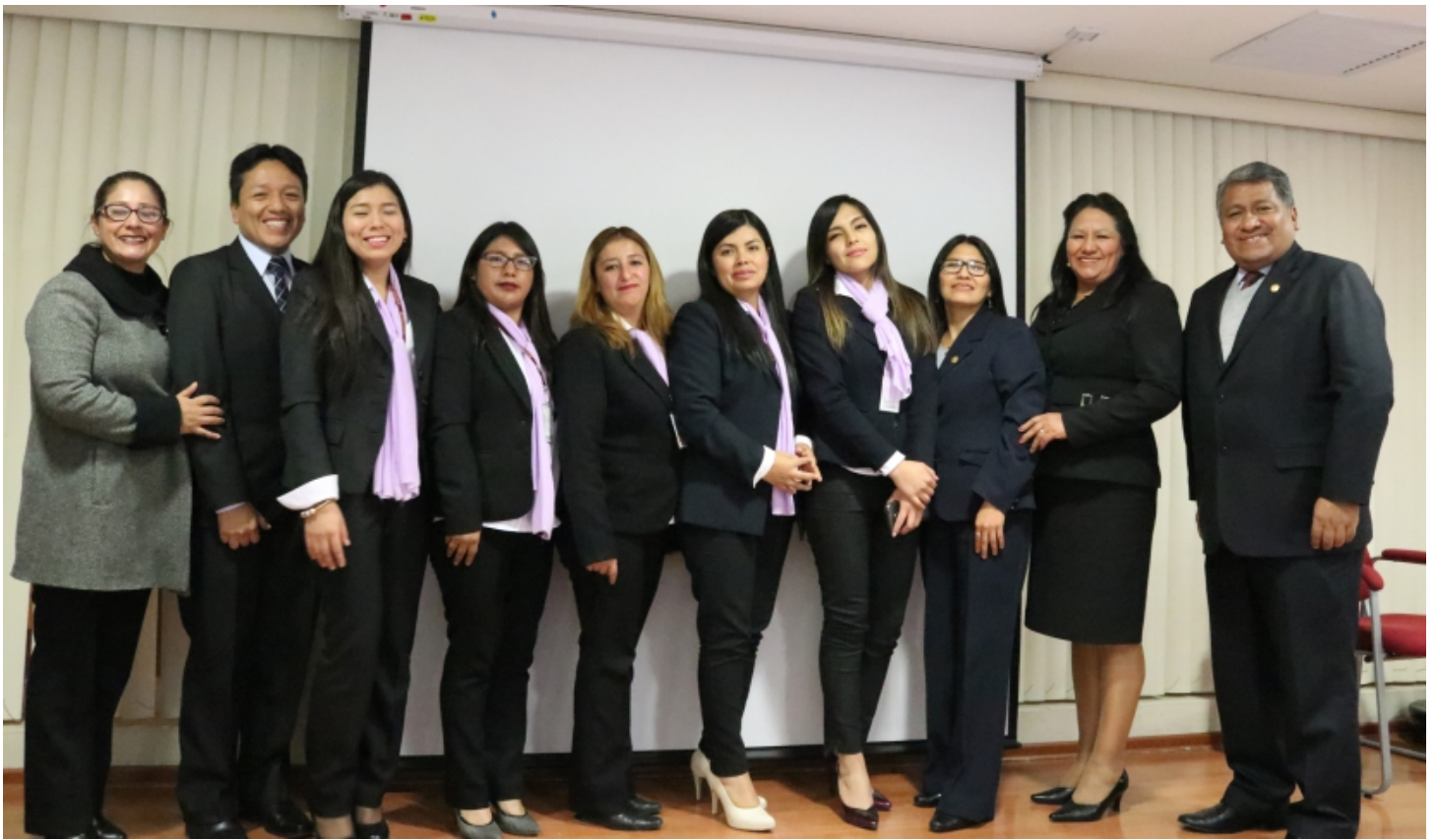
Equipo técnico del Programa PROGRESA “Juntos Contra la Violencia”

Los asistentes expresaron su agradecimiento a los profesionales que a través de las reuniones y las sesiones de terapia psicológica ayudaron al cambio de actitudes, es una experiencia que nos ayuda a vivir en armonía, sin agredir a nadie, dijeron.