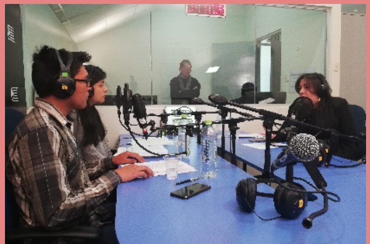
Set de radio de la Universidad Continental

días martes a la 9:00 a.m. por Radio Continental (online), bajo la conducción de estudiantes de la Escuela de Ciencias y tecnologías de la comunicación de la Universidad Continental y los temas a tratar cada semana son los que competen al Módulo de Violencia.