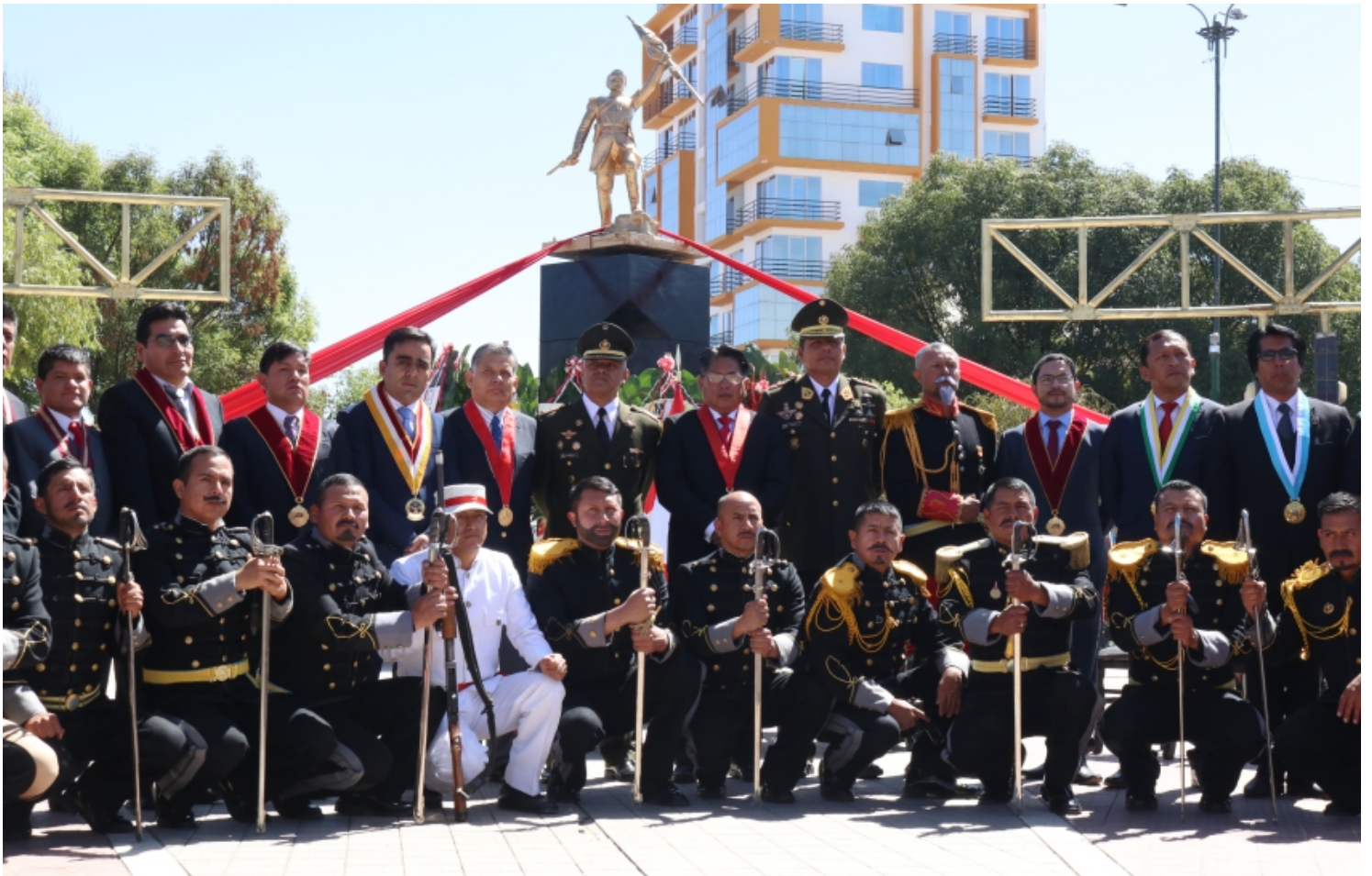
Parque Bolognosi – El Tambo , Huancayo

A nombre de los señores Jueces, personal jurisdiccional y administrativo, de la Corte de Junín, expresamos el saludo cordial y afectuoso al general de Brigada Ejército Peruano JUAN EDUARDO BACA COLCHADO, Comandante General de la Trigésima Primera Brigada de Infantería y a todos los soldados acantonados en la región central, refirió el Presidente de la Corte.