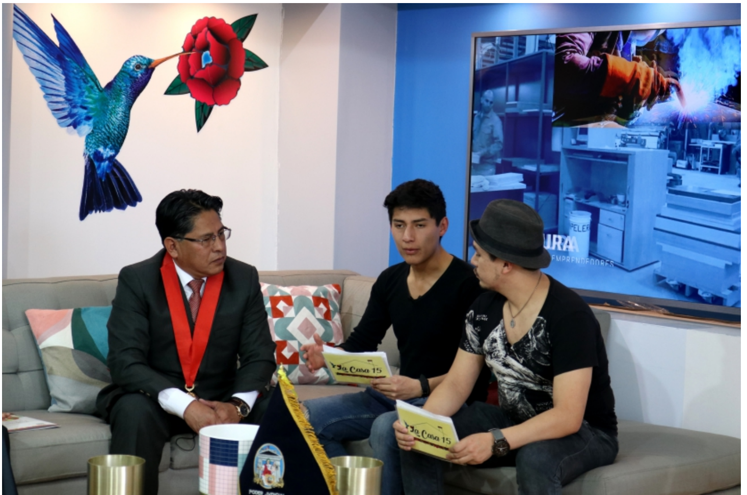
CADENA DG – Set de Televisión , Programa La Casa 15